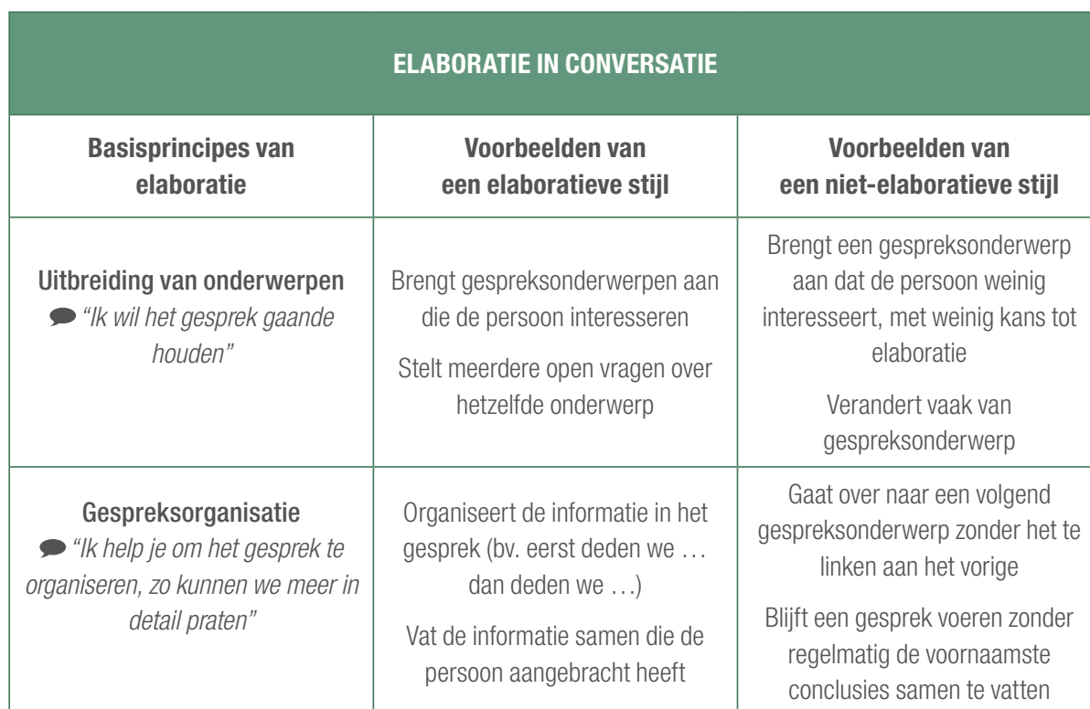
Tabel 2: Voorbeelden van elaboratieve en niet-elaboratieve conversatiestrategieën (vertaald en aangepast uit Togher e.a., 2010)

In totaal namen 3 zorgverleners van Zonnestraal vzw, een voorziening in Lennik die plaats en zorg biedt aan personen met een niet-aangeboren hersenletsel (NAH), deel aan het onderzoek. De zorgverleners werden geselecteerd door de pedagogisch verantwoordelijke van de voorziening op basis van de interesse voor het project en de communicatieve relatie met de persoon met hersentrauma. Er werd bewust gekozen om met een groepje van 3 zorgverleners te werken zodanig dat elke persoon de mogelijkheid had om elke vaardigheid intensief te oefenen en de zorgverleners elkaar ook